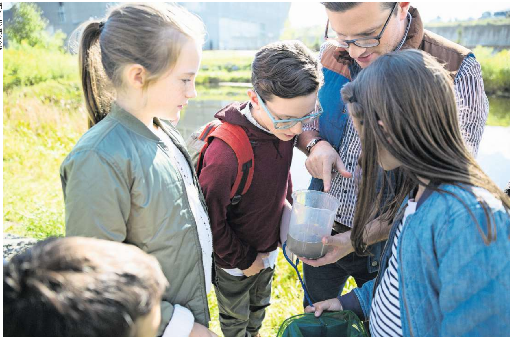
Mehr als essen, spielen und basteln: Die Schülerinnen und Schüler sollen zum Beispiel auch naturkundliche Kompetenzen aufbauen.

Wir würden unser Bildungspotenzial verschenken, wenn wir Tagesschulen frei von Aktivitäten halten würden. In anderen Ländern wie den USA, Südkorea oder Japan ist die ausserunterrichtliche Betreuung ganz klar als Bil-