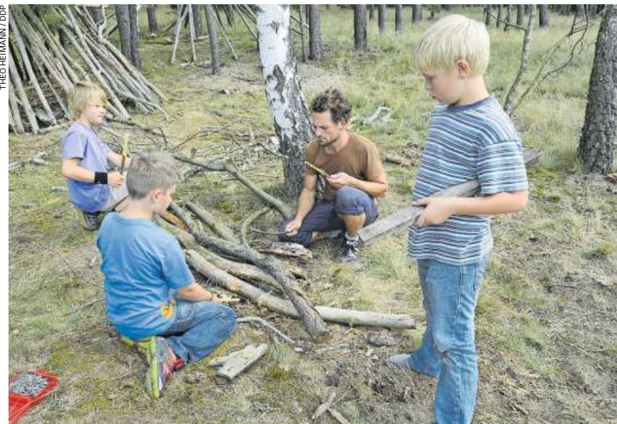
Naturpädagogik: Ein Betreuer trommelt mit Kindern im Wald.

Immer mehr dieser FaBe suchen eine Stelle in der schulergänzenden Betreuung. Wie kann das sein, wo die Berliner Studie doch kein sehr schönes Bild zeich-