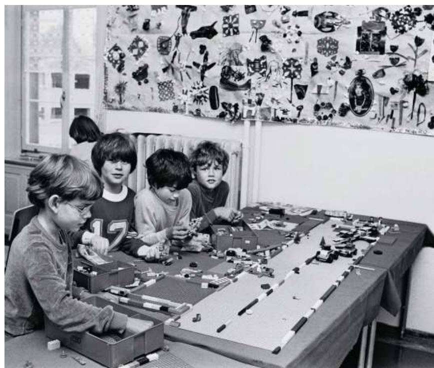
Eine der ersten Tagesschulen in Zürich: Kinder spielen Lego. (23. Juni 1981)