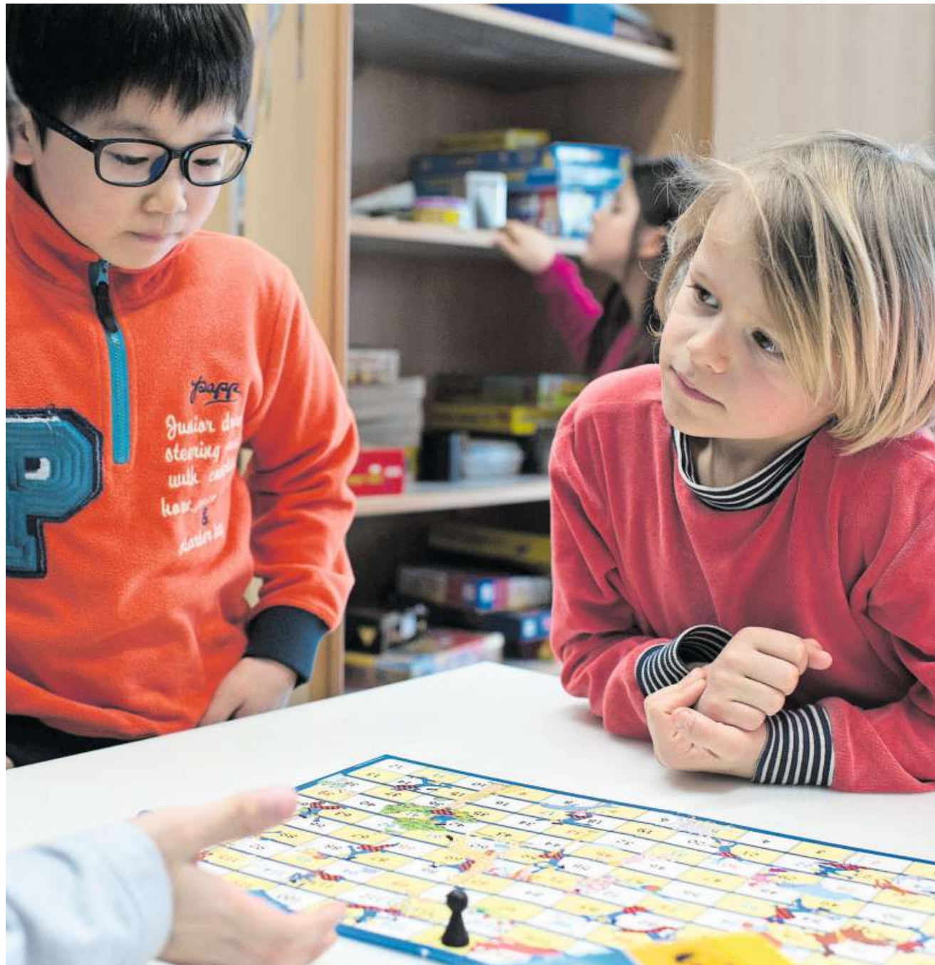
... und vergnügen sich auch mit altbekannten Brettspielen. (Zürich, 19. März 2018)

Unterrichtszeiten», heisst es dort. Eine Umfrage der Erziehungsdirektorenkonferenz zeigt, dass in vielen Kantonen mehr als die Hälfte der Schulen Mittagstische führen. Im Kanton Basel-Stadt nutzt jeder vierte Schüler eine Tagesstruktur. In der Stadt Zürich ist es jeder zweite, in wenigen Jahren sollen es 80 Prozent sein.