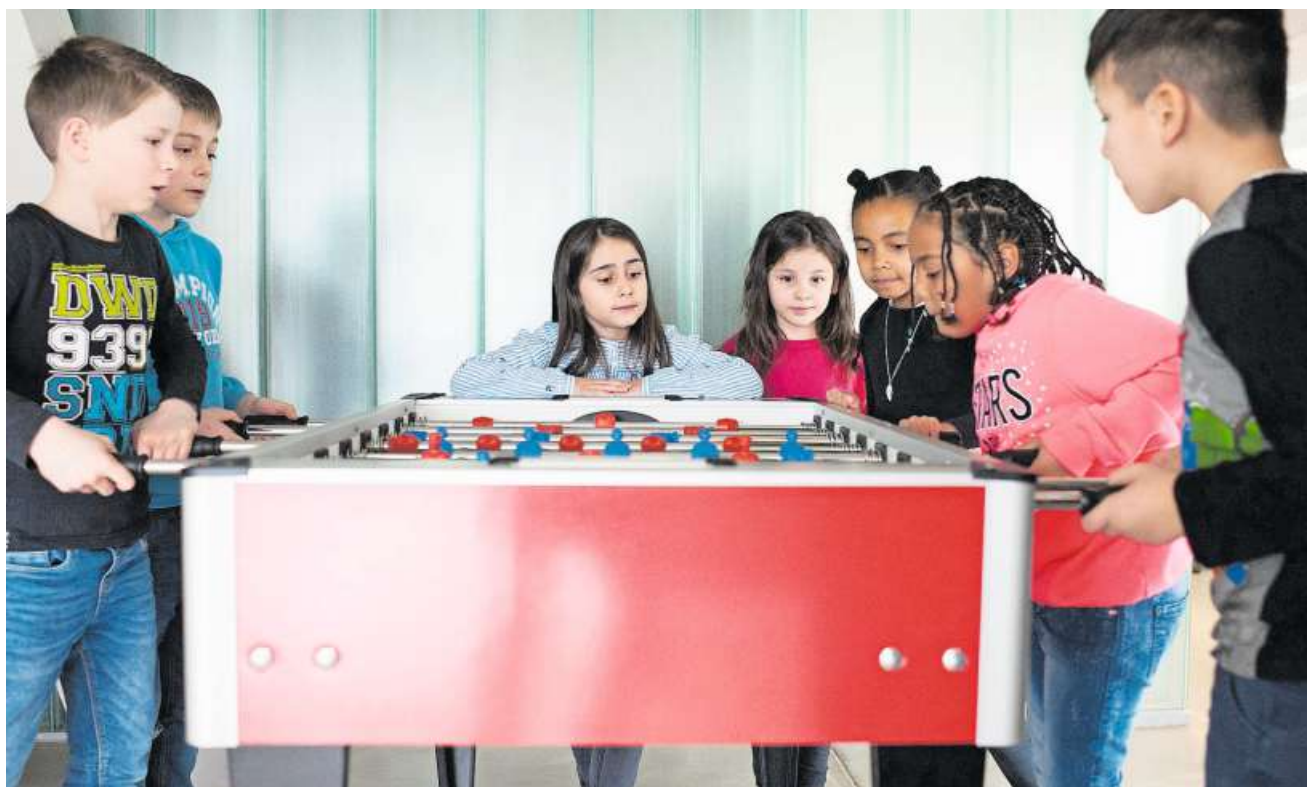
Der Töggelikasten wird über Mittag von Kindern belagert.

Graf hat den Wechsel zur Tagesschule mitorganisiert - und improvisiert. Jedes Detail kann zur Denksportaufgabe werden. Beispiel Zahnbürsten: 150 Stück stehen bereit. Doch wo aufbewahren? «Sie