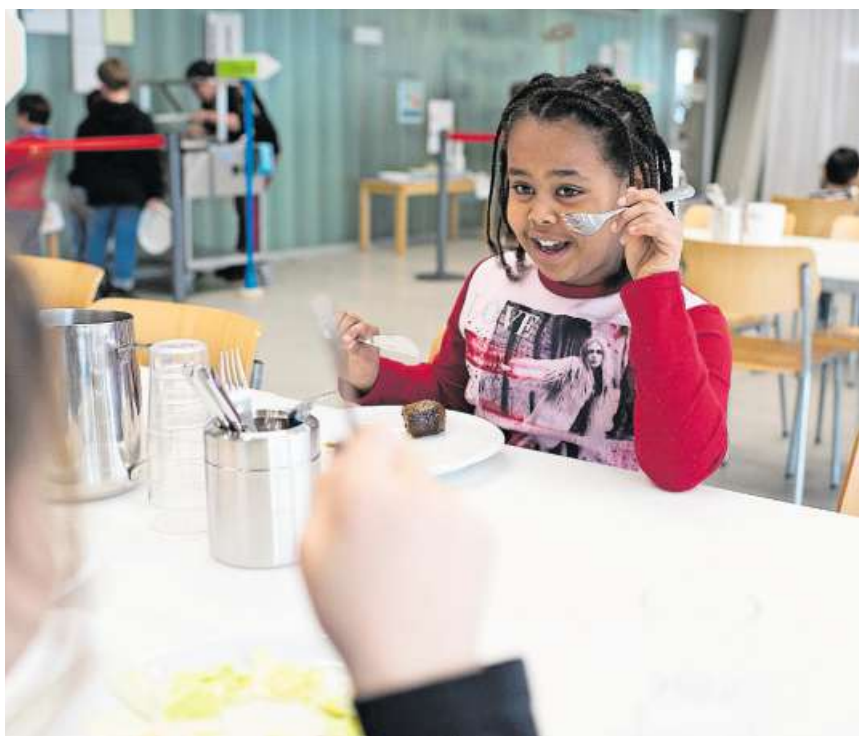
Im «Kinderrestaurant»: Heute gibt es Fleischvogel.

Oberflächlich betrachtet herrscht Chaos an der Tagesschule. Doch über dem Gewusel, dem Lärm von 450 Kindern, die jeden Tag über Mittag zu versorgen sind und in Spitzenzeiten über 2000 Mahlzeiten pro Woche verdrücken, steht eine akribische Organisation: Jedes Kind hat einen runden Magnet mit seinem Foto darauf, den es auf einer Wandtafel je nach Aufenthaltsort placiert. Nach der Unterrichtsstunde setzen die meisten Kinder den Magnet aufs Feld «Essen und Trinken». Das Menu ist absichtlich schweinefleischfrei, stets gibt es auch ein vegetarisches Menu. Allergien