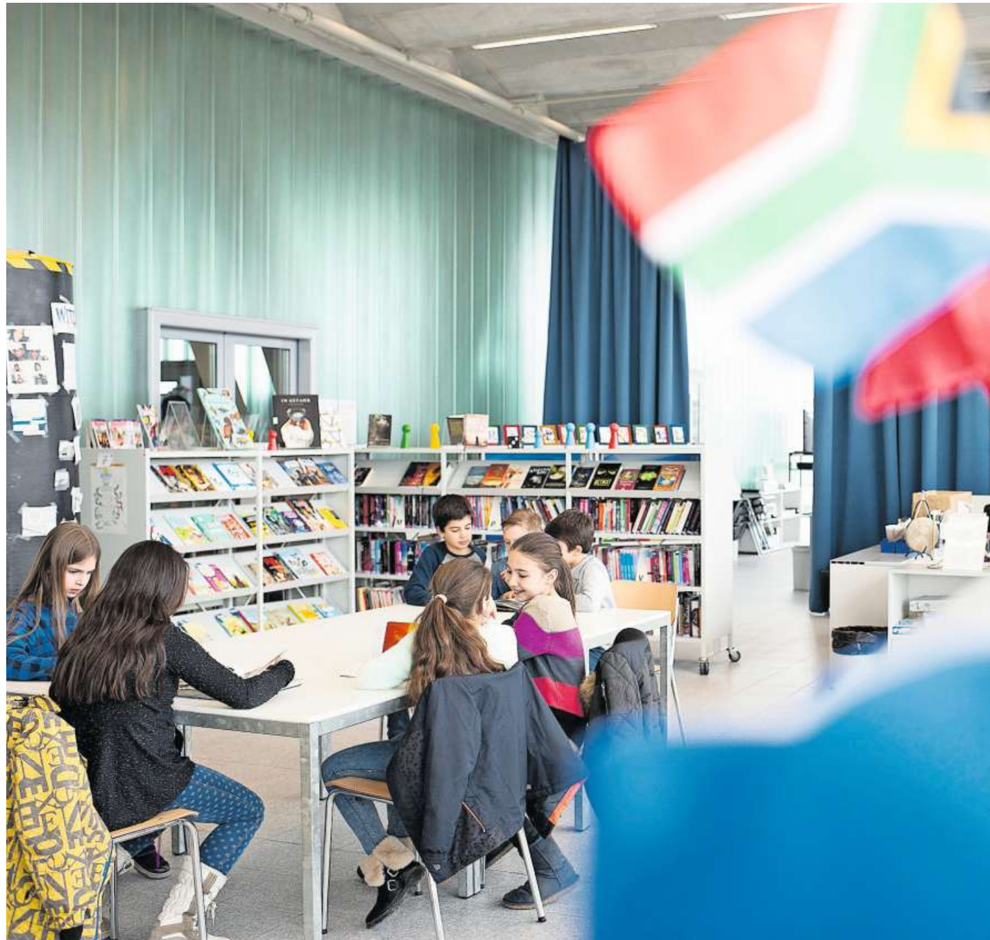
In der Tagesschule Leutschenbach geniessen die Kinder die grosse Bibliothek...