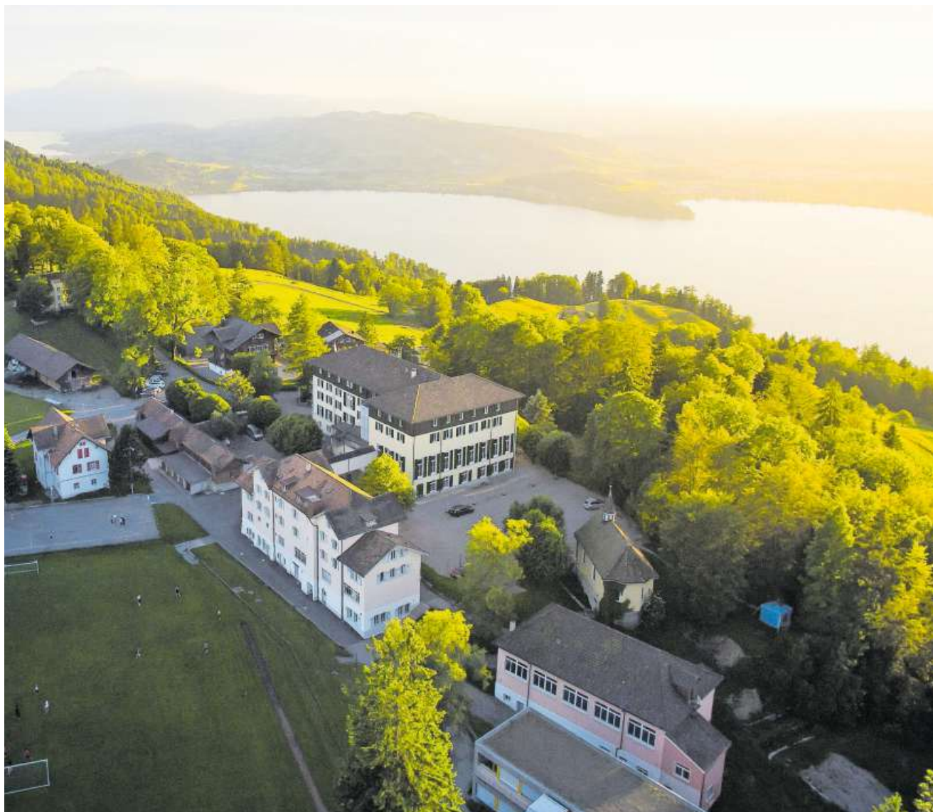
Pädagogische Förderung auch nach Schulschluss: Institut Montana am Zugerberg.

Privatschulen haben den Wunsch von Eltern nach Ganztagesbetreuung der Kinder früh aufgenommen. Da es nun vermehrt auch öffentliche Tagesschulen gibt, verlieren sie ein Verkaufsargument. Sie setzen darum auf besondere Angebote. Von Joëlle Weil